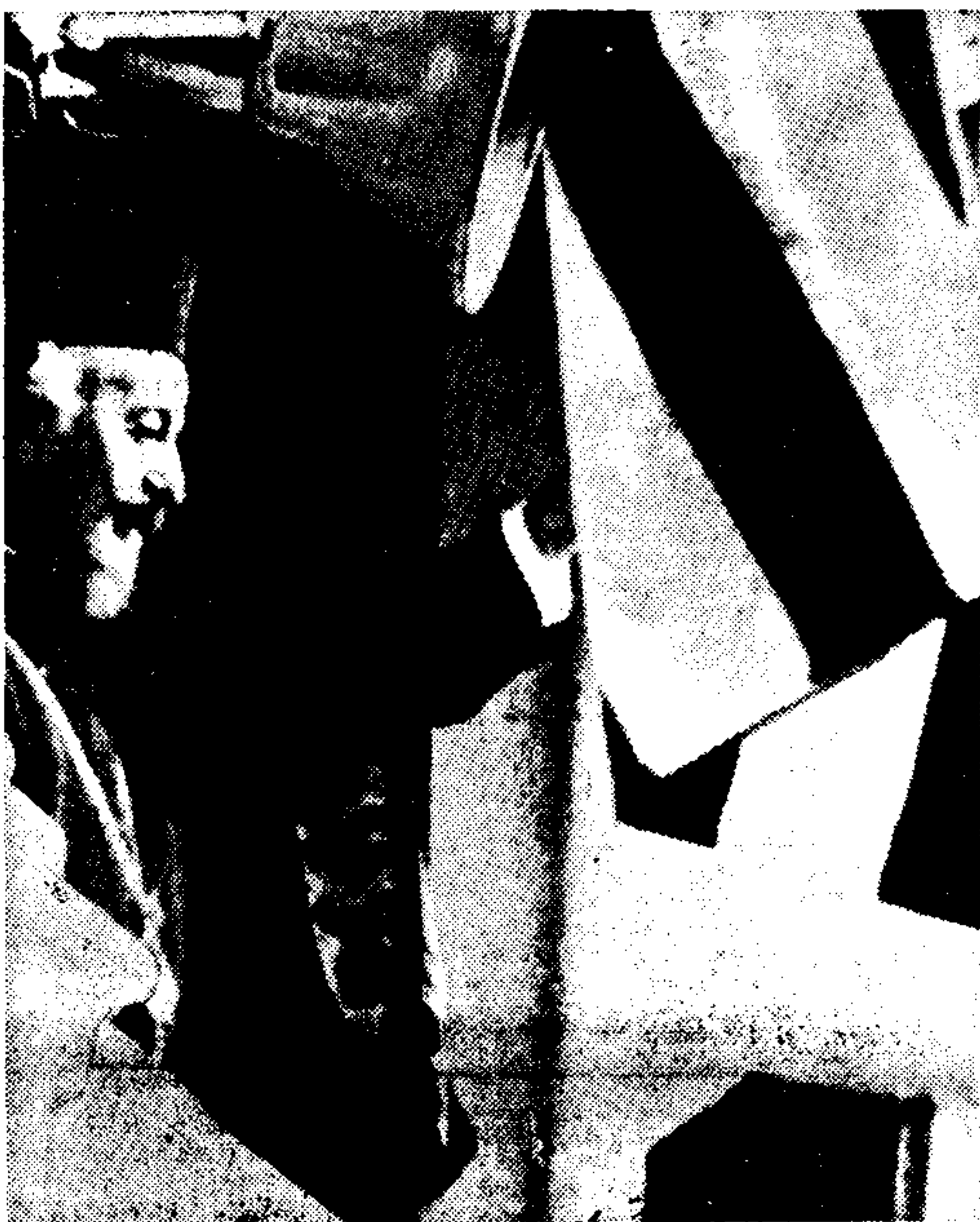
Ο πρόεδρος Μακάριος έκωνεί τόν βασιζόμενον λόγον του.